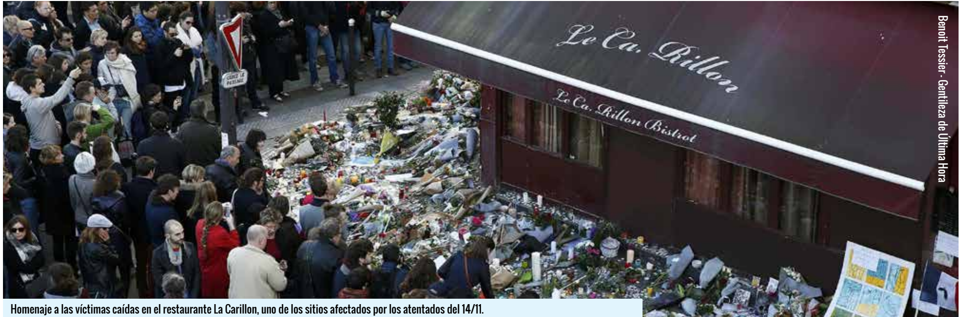
Homenaje a las víctimas caídas en el restaurante La Carillon, uno de los sitios afectados por los atentados del 14/11.