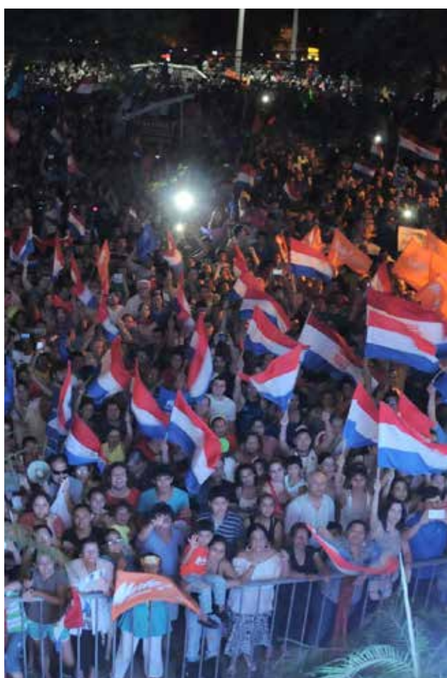
Por encima de los colores, sobresale la tricolor