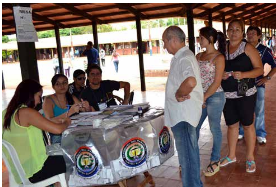
El ejercicio del voto: derecho y obligación ciudadanos