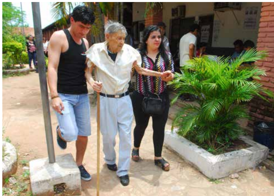
No hay impedimento cuando hay voluntad y conciencia cívica

Sin lugar a dudas, los cinco años venideros serán una prueba de fuego para Ferreiro que no duda en responder que apunta más alto, pero por ahora, tiene mucho por hacer, comenzando por cumplir sus promesas electorales.