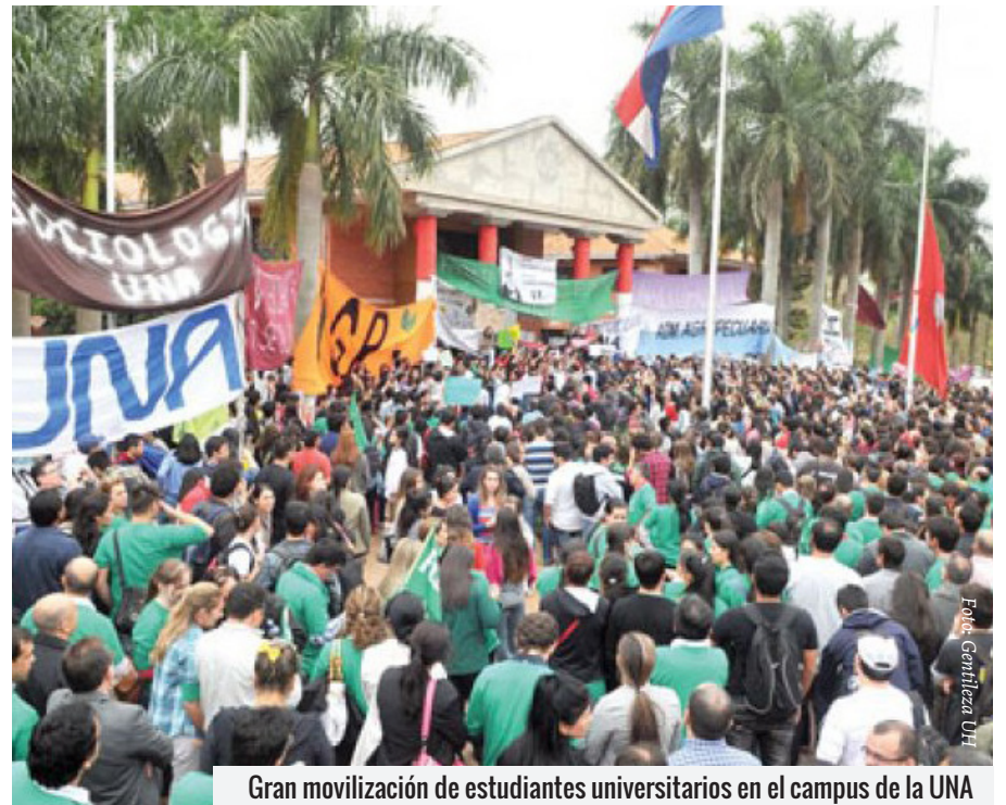
Gran movilización de estudiantes universitarios en el campus de la UNA

A partir de publicaciones con base en investigaciones periodísticas hechas por el diario Última Hora, desde el 8 de setiembre pasado, que puso al descubierto un esquema amplio de corrupción en la UNA- comenzó la indignación de los jóvenes estudiantes paraguayos. Dejaron a un lado la apatía y se movizaron. Primero en el campus de San Lorenzo. Luego salieron a escrachar al Rector, pedir su renuncia y obligando a la Justicia a cumplir su tarea en tiempo récord.