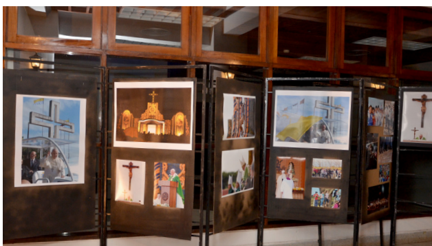
Muestra fotográfica sobre la visita Papal.