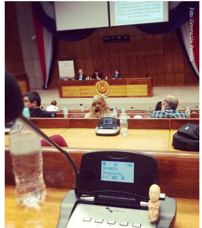
Audiencia Pública del 19 de mayo, 2015